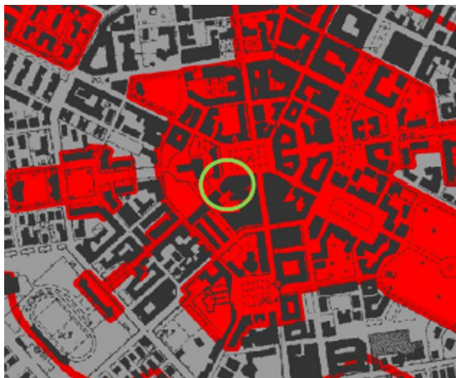
Tav. A - Paesaggio dei centri e Nuclei Storici con relativa fascia di rispetto di 150 m (Art. 30 NTA)

Adottato dalla Giunta Regionale con atti n. 556 del 25/07/2007 e n. 1025 del 21/12/2007 ed approvato con Deliberazione del Consiglio Regionale n. 5 del 21/04/2021